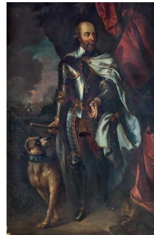
4. att. Glezna “Volters fon Pletenbergs ar suni” Nordkirhenes pili

Voltera fon Pletenberga portretējumā viņš redzams rotājies arī ar Vācu ordeņa virsmestra regālijām. Acīmredzot grāfam Frīdriham Pletenbergam tas nav bijis gluži maznozīmīgi – demonstrēt, ka Pletenbergi reiz ir bijuši virsmestri un impērijas firsti. Patiesībā pēc Prūsijas sekularizēšanas Volters fon Pletenbergs – tāpat kā pārējie Livonijas