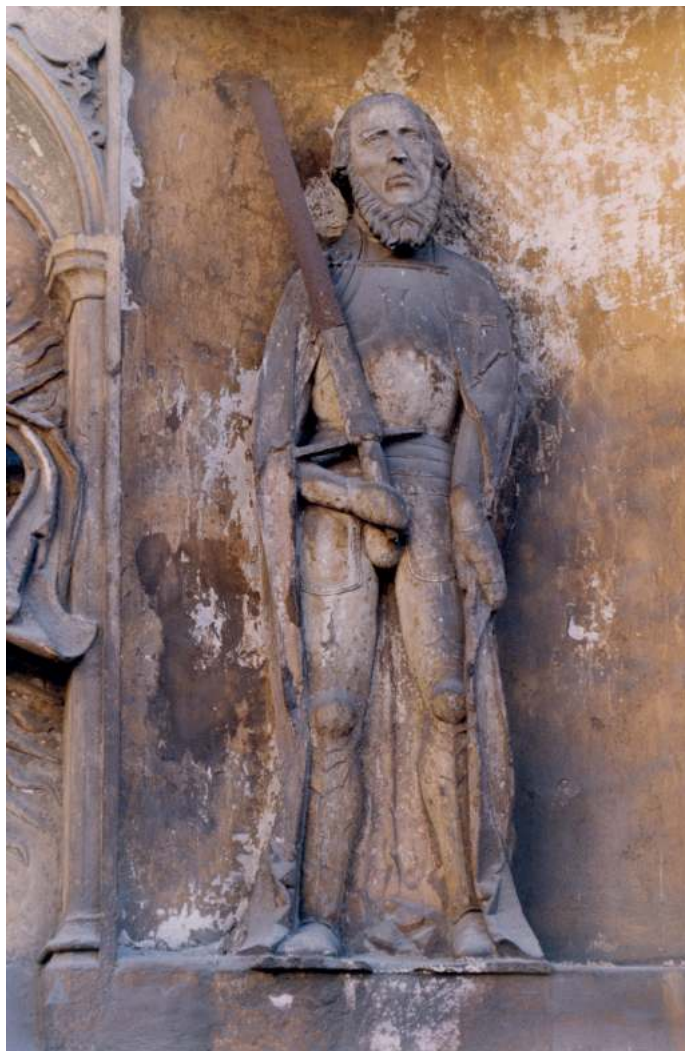
1. att. Voltera fon Pletenberga statuļa ordeņa pilī Rīgā LNVN, MDDK 1097:18