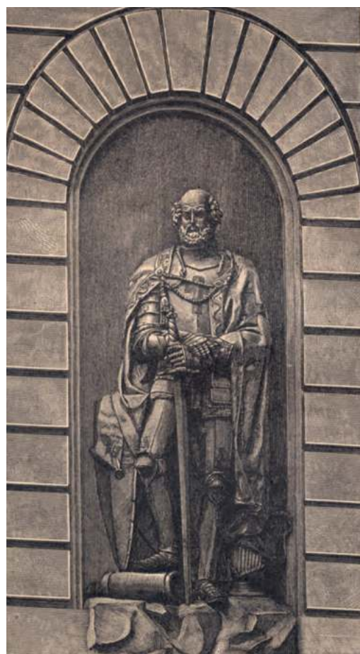
7. att. Dāvida Jensena darbnīcā izgatavotā Voltera fon Pletenberga skulptūra Rīgas Bruņniecības nama nišā (Seraphim 1895)

Par Pletenberga portreta turpmāko attīstību liecina ordeņa mestra skulptūra pilnā augumā, kas atradās 1870. gadā celtā Rīgas Bruņniecības nama (tagad Latvijas Republikas