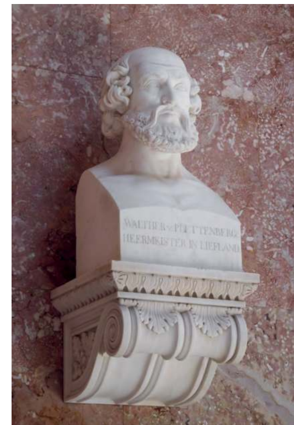
5. att. Tēlnieka Ludviga Švāntālera darinātā Voltera fon Pletenberga biste (1832) Valhallā, Donauštaufā