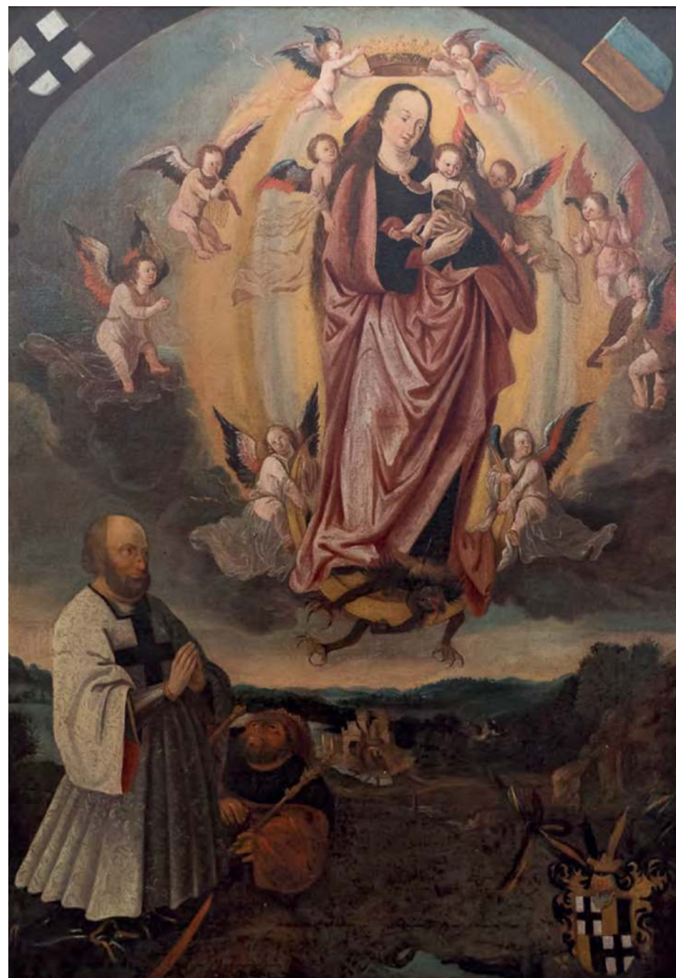
2. att. Nordkirhenes pilī esošā votīva glezna ar Volteru fon Pletenbergu