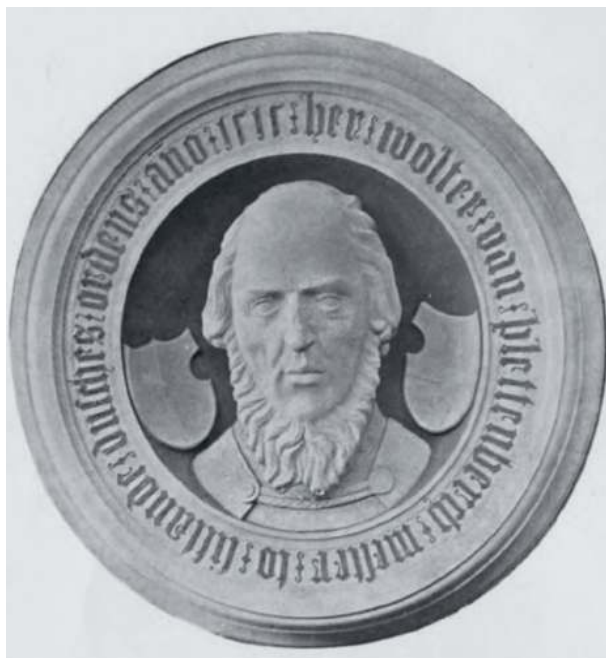
9. att. Augusta Franca Lēberehta Folca veidotais Voltera fon Pletenberga cilnis (1885) (Arbusow 1908)